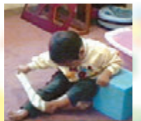
©2005 ~ 2006

脳性まひの子どもの日常生活動作において、お風呂とトイレ動作は自立が難しく、また体が大きくなるにつれて介助も大変になっていきます。日常生活動作の自立は、将来的にも介助者の負担軽減や本人の社会生活において非常に重要な要素です。日常生活動作の学習においては、動作の一連の流れをイメージできることが大切です。難しいところは一緒に手をとって誘導しながら援助を行うことで、活動のイメージにつながりやすくなります。このDVDでは、援助によりお風呂の出入りの経験を積み重ねた結果、一人で出入りができるようになった場面を紹介しします。またトイレ動作では、姿勢のサポートは必要なもの、子どもが自分で行うことを意識し、お母さんの介助が楽になっていく様子を紹介しします。